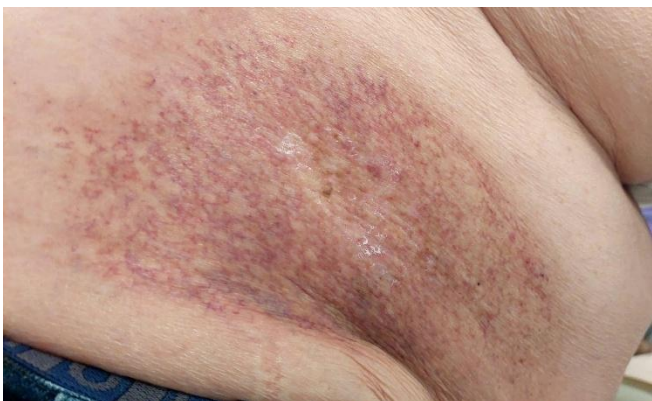
Figura 1: Grado 1: eritema leve, descamación seca y depilación.