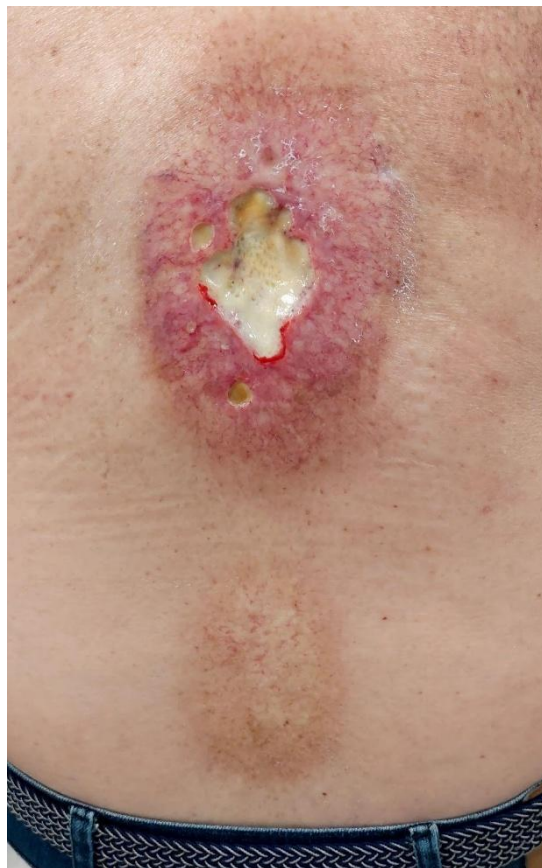
Figura 2: Grado 4. Ulceración de todo el espesor de la dermis